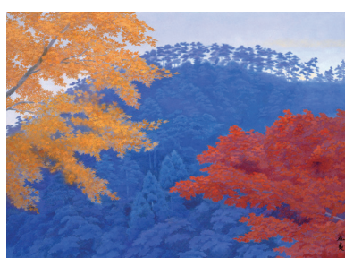
東山魁夷 《秋彩》 Higashiyama Kaii Autumn Colors

和歌で名高い小倉山の秋の夕景を描いた作品を和菓子でかた取りました。中には黄緑色の鮮やかな柚子あん入り。（柚子あん）