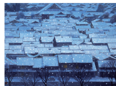
東山魁夷 《年暮る》 Higashiyama Kaii End of the Year

歳末の夜、古都にしんと降る雪と町家の屋根を、きんとんと錦玉羹で和菓子にしました。冬の風情を感じさせるひと品です。（黒糖風味大島あん・錦玉羹）