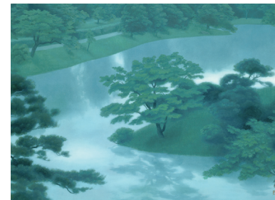
東山魁夷 《緑潤う》 Higashiyama Kaii Pervasive Verdure

常緑樹と苔の緑が映える修学院離宮の庭園を透明感のある錦玉羹と羊羹で表現し、抹茶風味に仕上げました。（錦玉羹・羊羹・淡雪羹）※卵を使用しています。