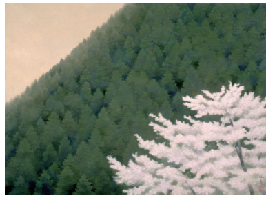
東山魁夷 《春静》 Higashiyama Kaii Spring Calm

鷹ヶ峰の深い緑色をイメージし、淡雪羹と錦玉羹の桜をアクセントに添えました。中は上品な甘さのこしあんです。（こしあん・淡雪羹・錦玉羹）※卵を使用しています。