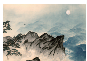
横山大観 《夏の海》 Yokoyama Taikan Sea in Summer

岩壁に激しく打ち寄せる波をきんとんで表現し、羊羹で作った海鳥と淡雪羹の月を添えて夏の海を和菓子にしました。 (黒糖風味大島あん・淡雪羹・羊羹) ※卵を使用しています。