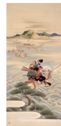
小堀鞆音 《那須宗隆射扇図》 Kobori Tomoto Nasu no Yoichi (Munetaka) Trying to Hit a Swinging Fan with an Arrow: Scene from the Tale of the Heike

源平合戦・屋島の戦いの名場面、遠く離れた船上の扇を射る那須与一の矢を和菓子で表現しました。中は鮮やかな黄緑色の柚子あんです。 (柚子あん・淡雪羹) ※卵を使用しています。