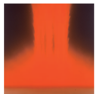
千住博 《フォーリングカラーズ》 Senju Hiroshi Falling Colors

色鮮やかに描かれた滝をモチーフに、錦玉羹と羊羹で涼感いっぱい仕上げました。見るものを魅了する、ひと品です。 (ワイン風味錦玉羹・羊羹)