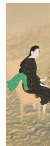
小林古径 《河風》 Kobayashi Kokei River Breeze

足先を川の水に浸して涼を取る娘。娘が持つ、桔梗が描かれた団扇をかたどりました。杏入りの練切りとこしあんは控えめな甘さです。 (杏入り練切り・こしあん)