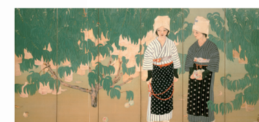
福田平八郎 《桃と女》 Fukuda Heihachirō Young Women and Peach Trees

平八郎が描いた《桃と女》から桃をモチーフに、やさしい色合いの和菓子をお作りしました。※桃の風味ではありません(柚子あん)