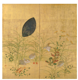
酒井抱一 《秋草鶉図》【重要美術品】 Sakai Hōitsu Autumn Plants and Quails [Important Art Object]

秋草に月と鶉を描いた抱一の金屏風をイメージしたきんとんです。月と鶉は羊羹で表現しました。(黒糖風味大島あん・羊羹)