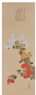
酒井抱一 《菊小禽図》 Sakai Hōitsu Chrysanthemums with Bird

抱一が描いた菊の花を清楚な和菓子に仕上げました。中は風味豊かな胡麻入りのこしあんです。(胡麻入りこしあん・錦玉羹)