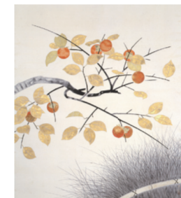
小林古徑 《秋采》 Kobayashi Kokei Autumn Fruit

移りゆく秋の情景を描いた作品から、色づいた柿をかたどりました。菊家特製の上質な素材を使ったこしあん入り。※柿の風味ではありません(こしあん・錦玉羹)