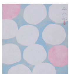
福田平八郎 《紅白餅》個人蔵 Fukuda Heihachirō Red and White Mochi ◇Private Collection

斬新で意匠性に富んだ平八郎の作品を題材に、紅白のお餅を淡雪羹で表した自慢の逸品。なめらかな食感が特徴の和菓子です。(淡雪羹・羊羹) ※卵を使用しています。